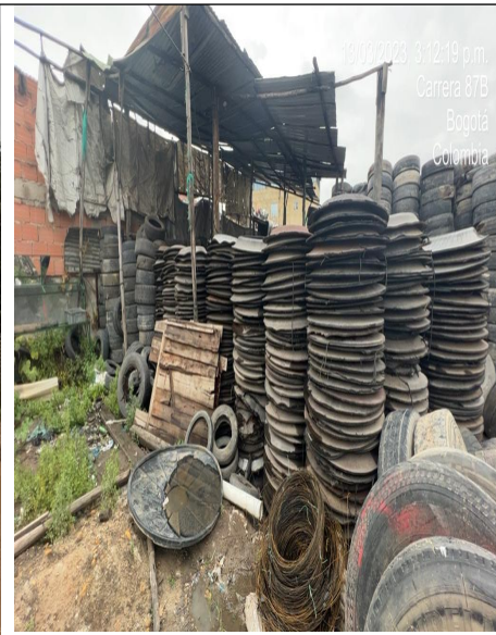
Foto 2. Vista general del acopio de llantas.