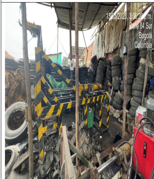
Foto 3. Vista general del acopio de llantas.