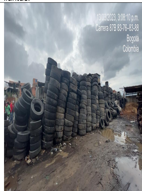
Foto 4. Vista general del acopio de llantas.